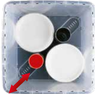
ok. 60 talerzy Ø 19 cm

Rura stabilizacyjna jest mocowana w dnie pojemnika i pokrywie za pomocą specjalnych wypustek.