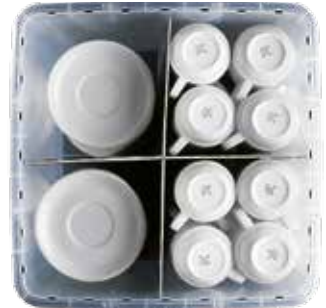
ok. 56 filiżanek i spodków