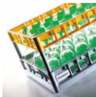
Systemy koszy 600 x 400 dla logistyki i cateringu