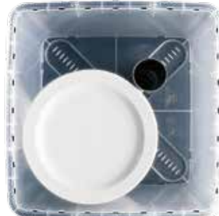
ok. 24 talerzy Ø 26 cm