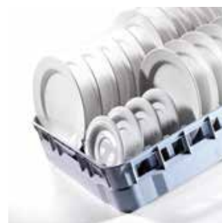
Systemy koszy 600 x 500 do zmywarek przelotowych