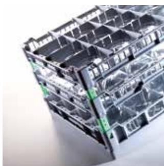
Systemy koszy 400 x 400 do zmywarek barowych (podblatowych)

Proszę zapoznać się z różnorodnością naszych produktów.