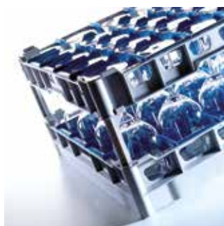
Systemy koszy 500 x 500 do standardowych zmywarek gastronomicznych